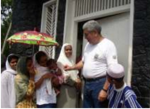
الرعاية الطبية للناجين من التسونامي في منطقة غاليه بسريلانكا