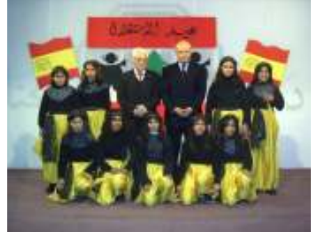
ومدرسة الأطفال اليتامى في بيروت

◀ نقل الأطفال الأفغان الذين يعانون من مرض أو إصابة خطيرة إلى إسبانيا لتلقي العلاج الطبي في المراكز الصحية في إسبانيا.