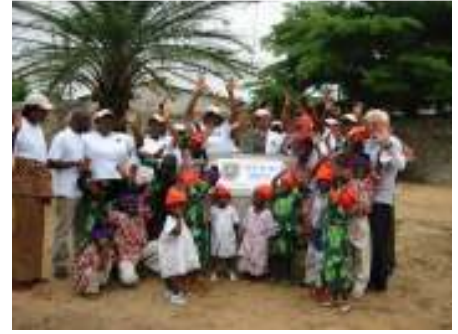
مركز الطفولة المبكرة في آدادا