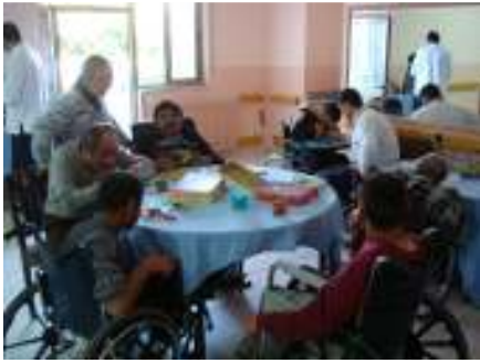
ومركز للمرضى النفسيين بالقدس