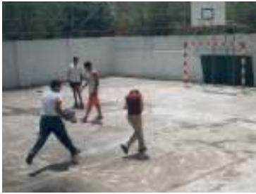
أنشطة الترفيه الصحي،

أنواع المراكز والبرامج التي تقدمها جمعية رُسل السلام للشباب والمراهقين هي: