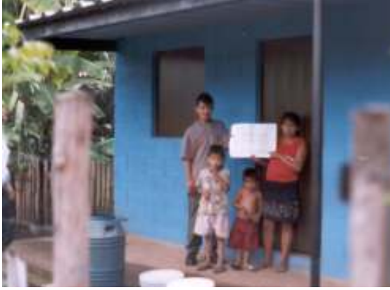
مسكن جديدة في تيبيكويو