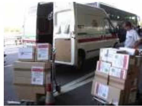
وباراغواي، إرسال الأدوية لجرحي حريق ضخم