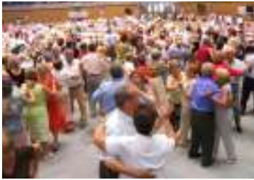
ومهرجان يوم الأجداد