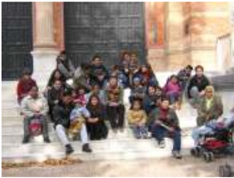
والتوفيق بين العمل