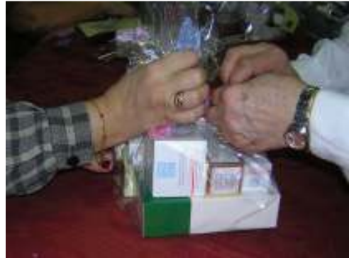
وحملة أعياد الميلاد