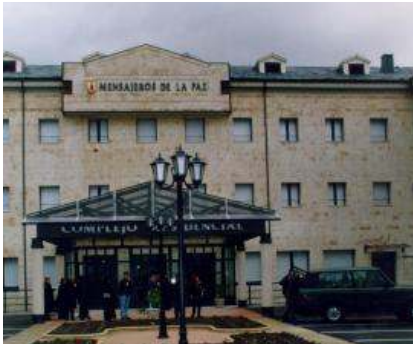
مباني دور المسنين

أنشأت جمعية رُسل السلام في منتصف الثمانينات جمعية العمر الذهبي لتلبية والاهتمام باحتياجات مجتمع كبار السن، وبعد وقت قليل ومع تضاعف عدد وحجم المشاريع المخصصة لكبار السن التي تقوم جمعيتنا بتنفيذها، أدركنا أنه ينبغي إنشاء جمعيات إقليمية مستقلة للعمر الذهبي في إسبانيا، تتمتع بالشخصية الاعتبارية والاستقلال المالي والاقتصادي، ولكنها تشترك في نفس الفلسفة، والمهمة، ونماذج الأداء والإدارة.