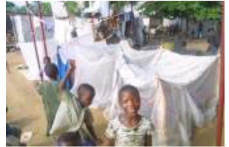
ومركز مساعدة اللاجئين