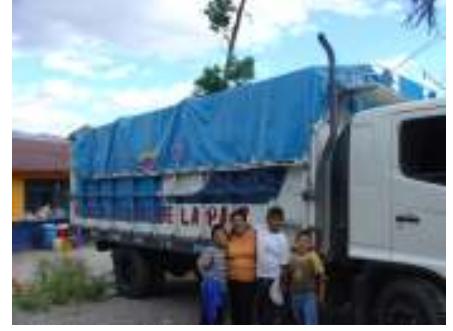
الإكوادور، مزرعة - بيت الطفولة