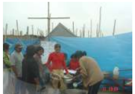
وبيرو، مساعدة ضحايا الزلزال في إيكا

◀ نقل وعلاج طبي وجراحي للأطفال الكولومبيين الذين يعانون من تشوهات شديدة.