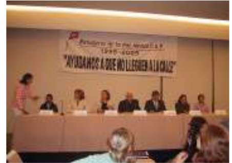
والمكسيك، تقديم حملة