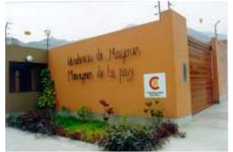
مطاعم الأطفال، وبيرو، دار المسنين

◀ تقديم المساعدات الإنسانية لضحايا الزلزال في مدينة بيسكو وإيكا وتشينتشا: إرسال وتوزيع الأدوية والأغذية وإطلاق مطاعم الأطفال الشعبية الطارئة.