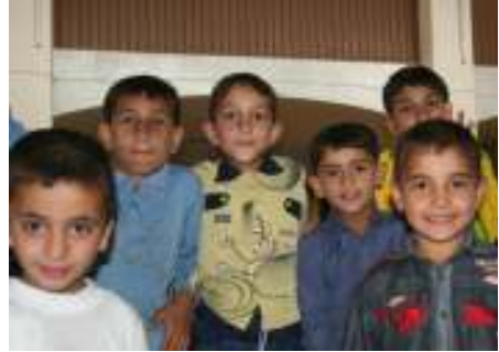
وأطفال دار الأيتام في أربيل