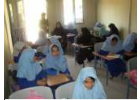
ومدرسة للبنات في مدينة بام، إيران،

◀ قضاء فترة عطلة الصيف في إسبانيا للأطفال الأيتام من جراء زلزال بام.