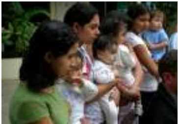
وبيت الأمهات المراهقات