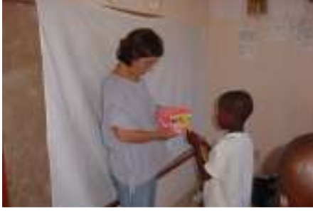
التعليم الصحي للطفولة

◀ مشروع تحسين الصحة والتعليم في منطقة إنغوافوما.