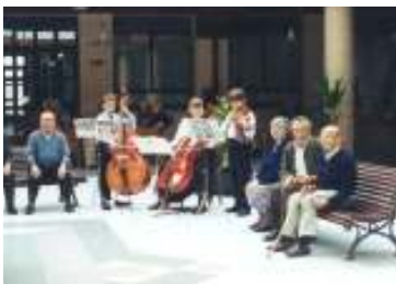
والأنشطة المشتركة بين الأجيال المختلفة