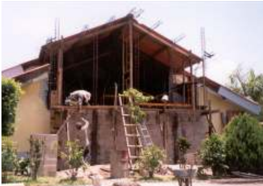
وأعمال إعادة الإعمار