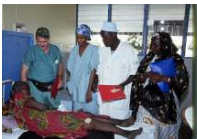
ومستشفى لامورديه في نيامي بالنيجر