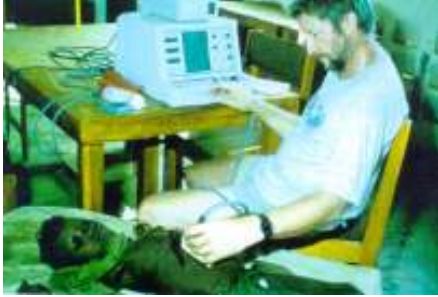
مكافحة داء العدري

◀ برنامج اجتماعي شامل لتقليل حالات ختان البنات من خلال التعليم والتوعية والتعبئة المجتمعية في منطقة لايبيا.