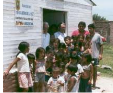
والمطاعم الاجتماعية للأطفال في توكومان