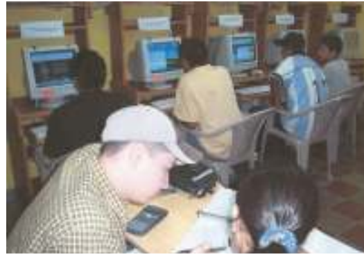
وصالة المعلوماتية والمكتبة الإلكترونية في سان سلفادور