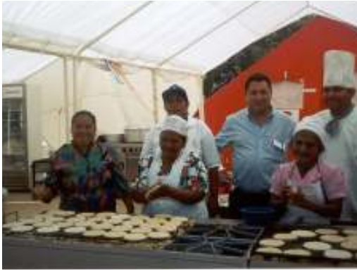
ومساعدة متضرري زلازل سانتا تكلا