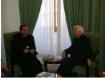
ومقابلة مع بطريرك اللاتين في القدس

◀ المساعدة في صيانة وتشغيل المراكز الاجتماعية والصحية التابعة للبطريركية اللاتينية في القدس والبطريركية الأرثوذكسية في القدس العتيقة.