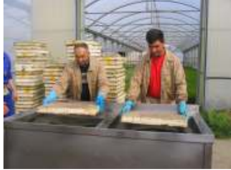
ودورة التدريب والتأهيل