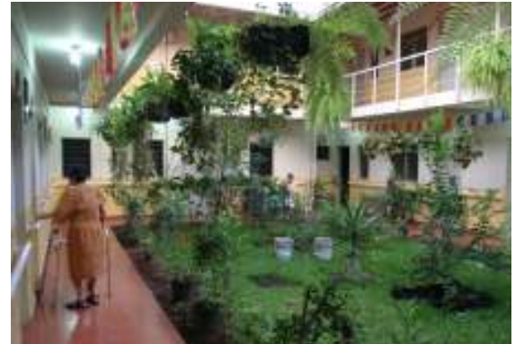
ودار المسنين في الأماتال