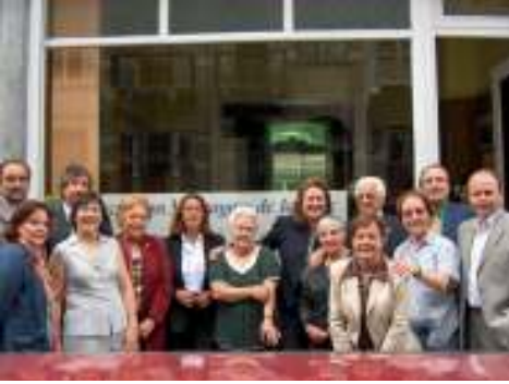
ومتطوعون من جمعية رُسل السلام في بروكسل