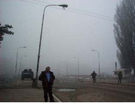
إعادة تأهيل البنية التحتية الكهربائية في إيستوك بكوسوفو

◀ مشروع المأوى المؤقت في إسبانيا لأسر اللاجئين من ألبان كوسوفو، وقامت بإرسال المواد الأساسية.