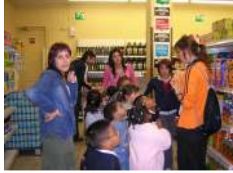
وبرامج صحة الأسرة،