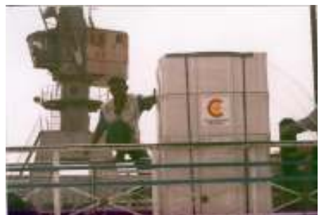
ووصول التبرعات إلى ميناء أم قصر (ميناء في البصرة)