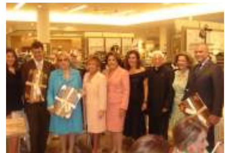
ودار المسنين في إيزالكو، والعشاء الخيري في ميامي بالولايات المتحدة الأمريكية