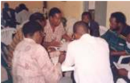
وتدريب القادة المحليين

◀ برنامج اجتماعي شامل للتدريب من أجل تحسين إدارة الثروة الحيوانية وتحسين الأوضاع الصحية للموارد المائية في منطقة توركانا.