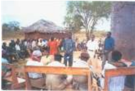
وجلسة حوارية للتوعية حول فيروس نقص المناعة البشرية المكتسبة / الإيدز

◀ مشروع متكامل لتخفيف آثار فيروس نقص المناعة البشرية المكتسبة / الإيدز على الاقتصاد والأمن الغذائي والصحة والتغذية في منطقة ماكوين.