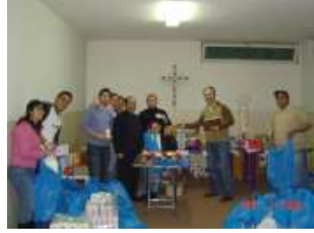
تجميع المواد الغذائية والأدوية في عمان (الأردن)