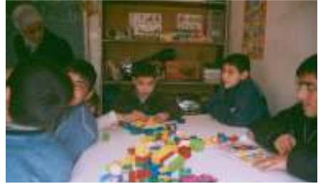
ومركز للمعاقين في بغداد