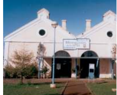
ومركز الدفاع عن الأسرة في سان ميغيل دي توكومان