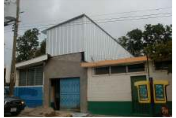
ومخزن الجمعية التعاونية "سانتا ماريا أوتسوما