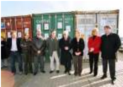
وإرسال مساعدات إنسانية إلى النيجر