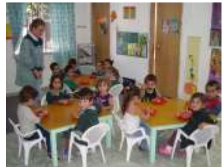
وأوروغواي، مركز طفولة