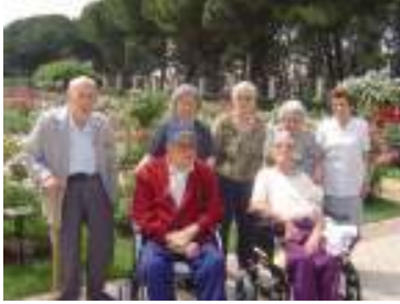
وأنشطة ثقافية وترفيهية