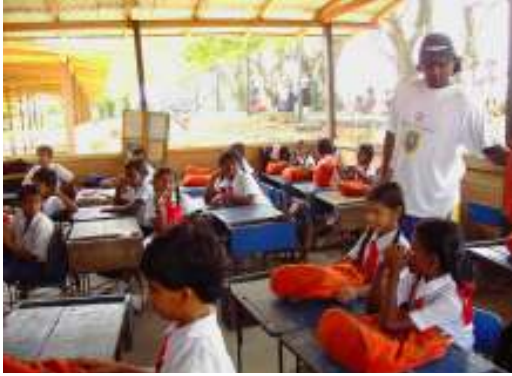
وتوفير المواد والمعدات المدرسية في دومي بسريلانكا