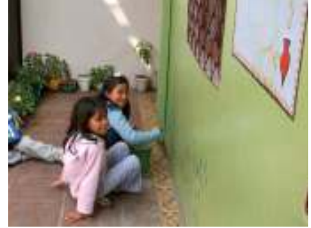
والإكوادور، مركز للأطفال