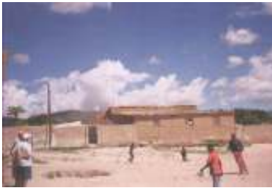
قطعة أرض مخصصة لملاعب رياضي

◀ برنامج تدريب مجتمعي لتحسين الأوضاع والظروف المعيشية للأطفال في منطقة موكورانغا.