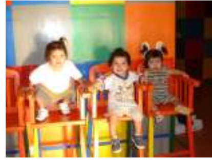
ودار إيواء الأطفال

المراكز والمشاريع الرئيسية التي تقوم بها جمعية رُسُل السلام لصالح الطفولة هي: