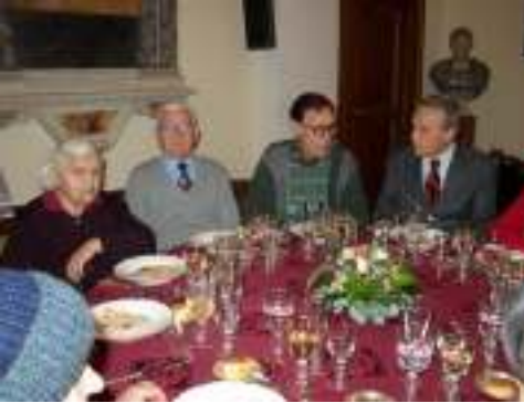
وروما: غداء أعياد الميلاد للمسنين المستفيدين من الجمعية