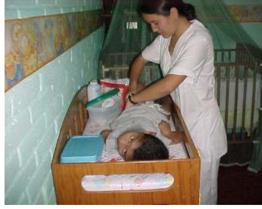
ورعاية الأطفال في سان سلفادور