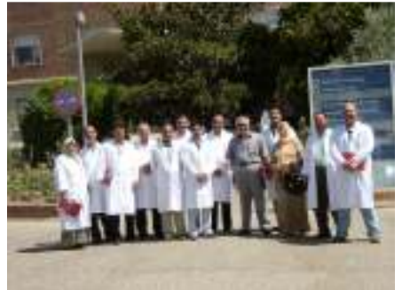
والأطباء العراقيين في دورة طب الطوارئ في إسبانيا