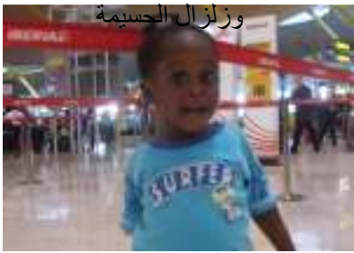
وظفل غينى بعد العلاج