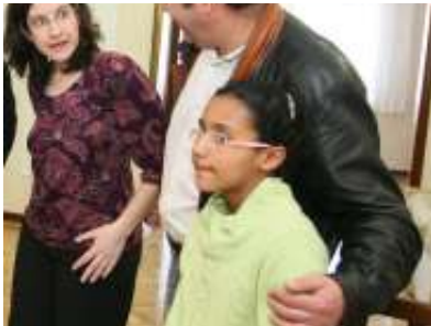
وقناة جزائرية تعالج في إسبانيا