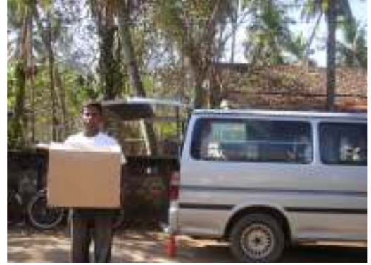
وتوزيع الأغذية والمهمات الأساسية للمشردين في غاليه بسريلانكا