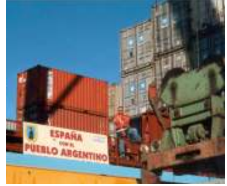
إرسال مساعدات إنسانية إلى السكان المتضررين من الأزمة

إرسال المساعدات الإنسانية لصالح ضحايا الفيضانات في سانتا فيه.