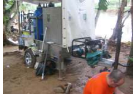
وشحن وتركيب محطات معالجة المياه في غاليه بسريلانكا