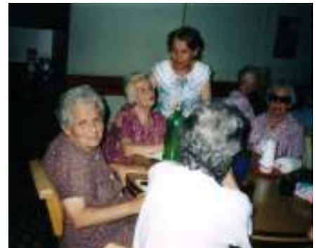
ومركز نهاري للمسنين في بوينس آيريس