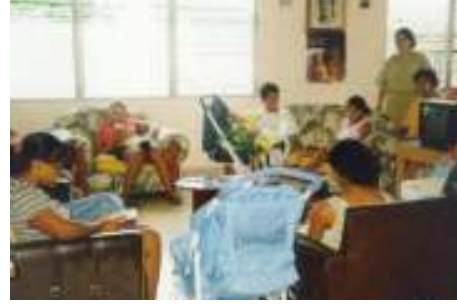
بنما، بيت الأمهات المراهقات

◀ بيت الأمهات المراهقات "لويزا ماك غرانت".