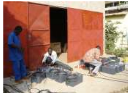
وكهربة المناطق الريفية