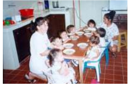
البيت - المدرسة، وبوليفيا

◀ مشروع متكامل للتعليم والتدريب من خلال خطة 3000 في سانتا كروز دي لا سييرا.