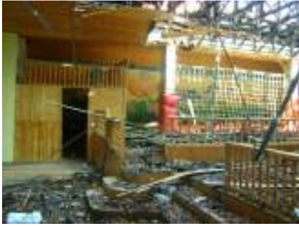
آثار القصف على قطاع غزة