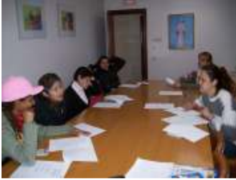
اللقاء الأسري خلال نهاية الأسبوع،

نفهم جمعية رُسل السلام الأسرة كدعامة المجتمع الأساسية، سواء أكانت تخضع لمفهوم الأسرة التقليدية، أم تدرج تحت النماذج الجديدة، فالأسرة تتكون من البالغين والأحداث الذين يعيشون جنباً إلى جنب في ظل أواصر المودة ويتشاركون في الوسائل والموارد والخبرات، وهذا هو الإطار الأنسب للتنشأة والنمو الملائم للإنسان.