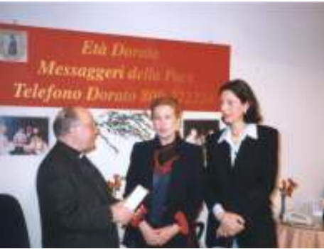
ومقر الهاتف الذهبي في روما

◀ تنظيم الأنشطة الثقافية والخيرية لجمع التبرعات والموارد.