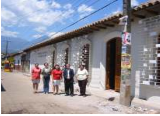
دار المسنين في أتيكيسايا