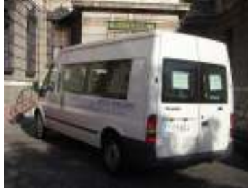
وسائل النقل المجهزة،