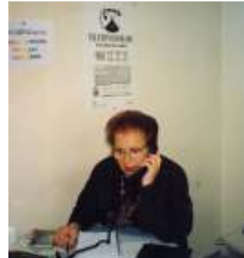
ومتطوعة تقدم خدمة الهاتف الذهبي

وهناك مشاريع أخرى نوليها عناية واهتماماً خاصاً منذ أكثر من عشر سنوات وهي خدمة الهاتف الذهبي ، والتي يتمثل هدفه الرئيسي في تخفيف حدة مشاكل الاتصال أو العزلة للمسنين وتقديم المساعدة لهم من خلال الإنصات بعناية لهم واهتمام واكتشاف حالات الهجر أو الظروف المعيشية الرديئة بهدف تحويلها إلى الخدمات الاجتماعية المختصة، ومحاولة الاستجابة التضامنية لبعض الاحتياجات المعينة.