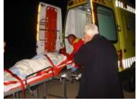
رحلة الأطفال المصابين في العراق لتلقي العلاج الطبي في إسبانيا

◀ دورة في طب حالات الطوارئ وطب الأطفال في إسبانيا للمتخصصين الطبيين في العراق.