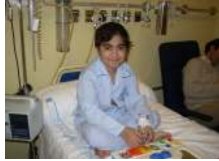
وطفل أفغاني في المستشفى