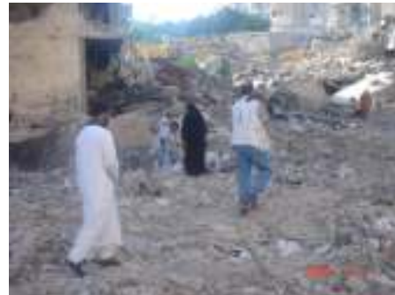
وتقديم المساعدة للضحايا بعد التفجيرات في بيروت (لبنان)

◀ نقل الأطفال اللبنانيين والفلسطينيين الذين يعانون من مرض أو إصابة خطيرة إلى إسبانيا لتلقي العلاج الطبي في المراكز الصحية في إسبانيا.