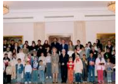
وأطفال بام مع جلالة ملكة أسبانيا